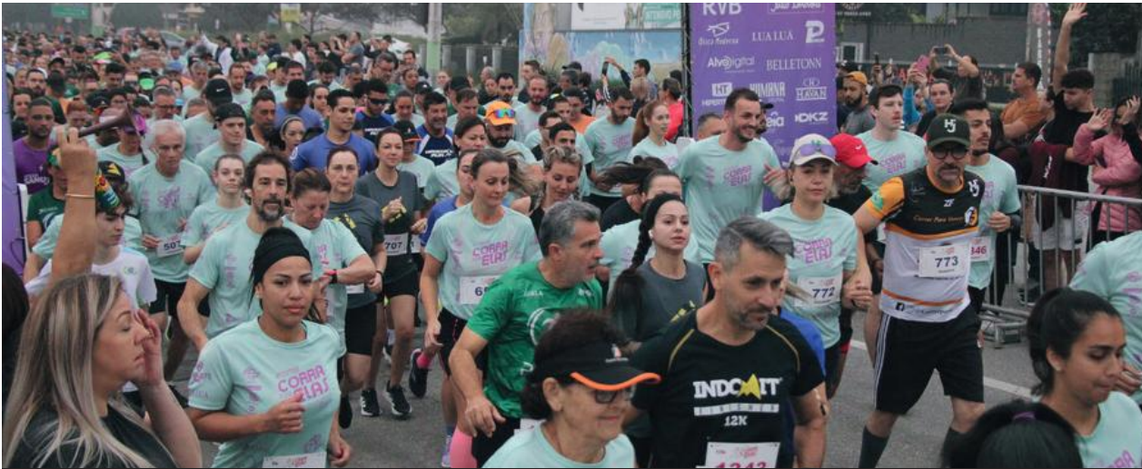
Cerca de 1,4 mil atletas participaram da corrida

Digital, Móveis Santa Rita, Ideia Comunicação Corporativa, Intelidata, Som Cardeal, Aradefe e Unimed.