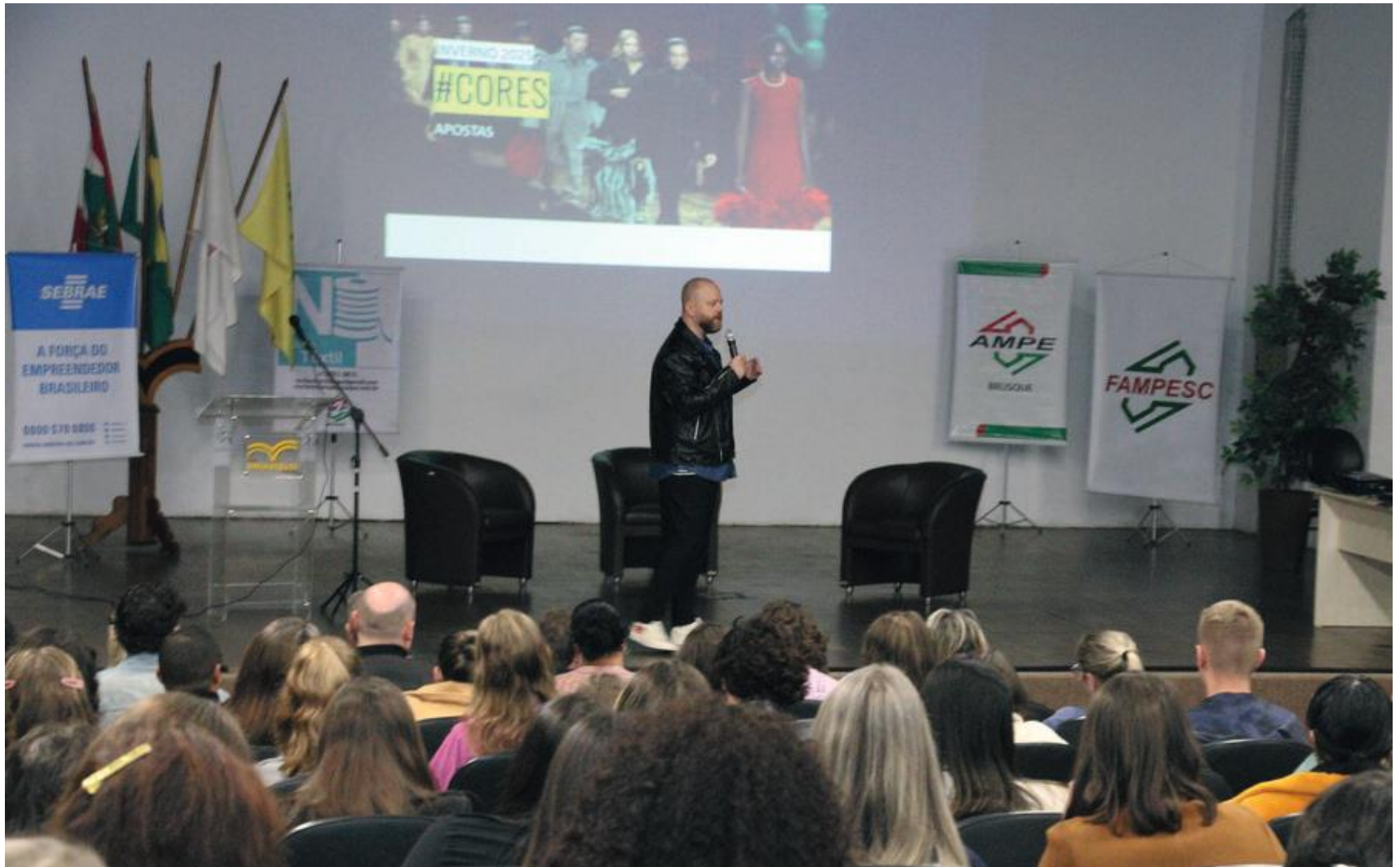
Palestra visa capacitar os associados para a elaboração da nova coleção