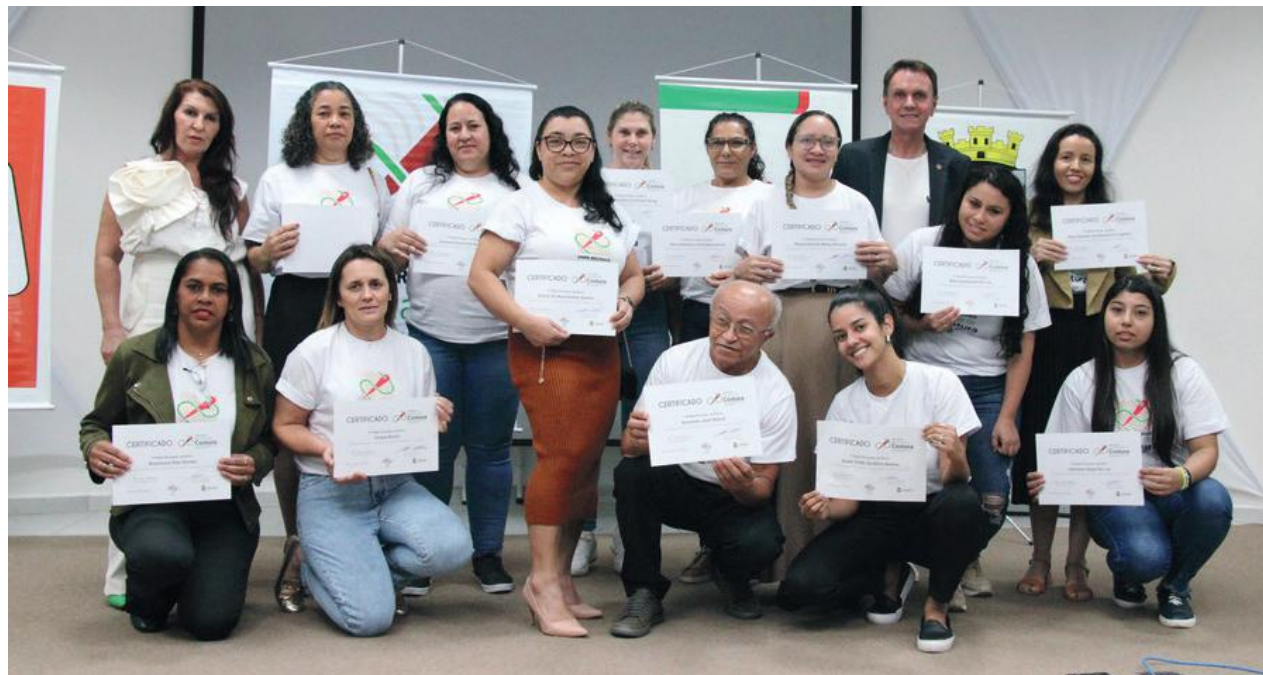
Ao todo, 57 alunos se formaram na capacitação. Na foto uma das turmas concluintes da Escola de Costura