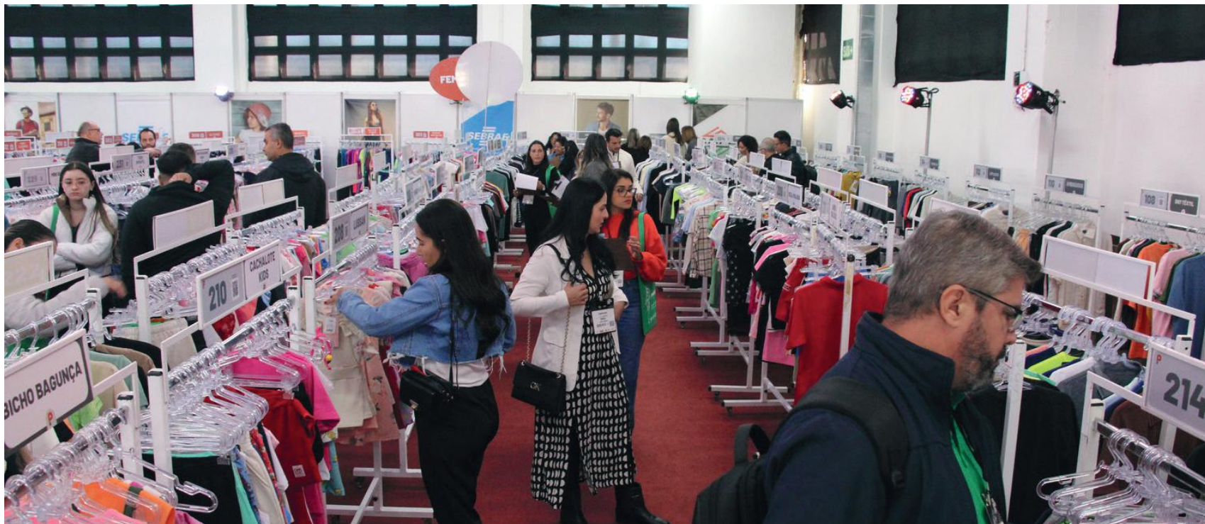
O evento considerado a maior rodada de confecção do país, reuniu no Pavilhão da Fenarrecó, mais de 700 lojistas ao longo de quatro dias de realização, que adquiriram produtos da coleção Alto Verão 2025